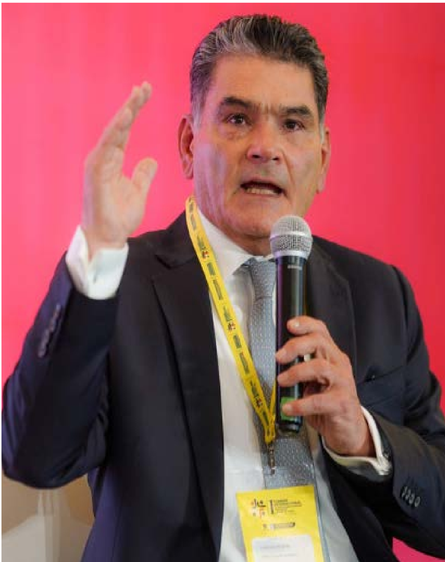
Gregorio Eljach Pacheco, Procurador General de la Nación