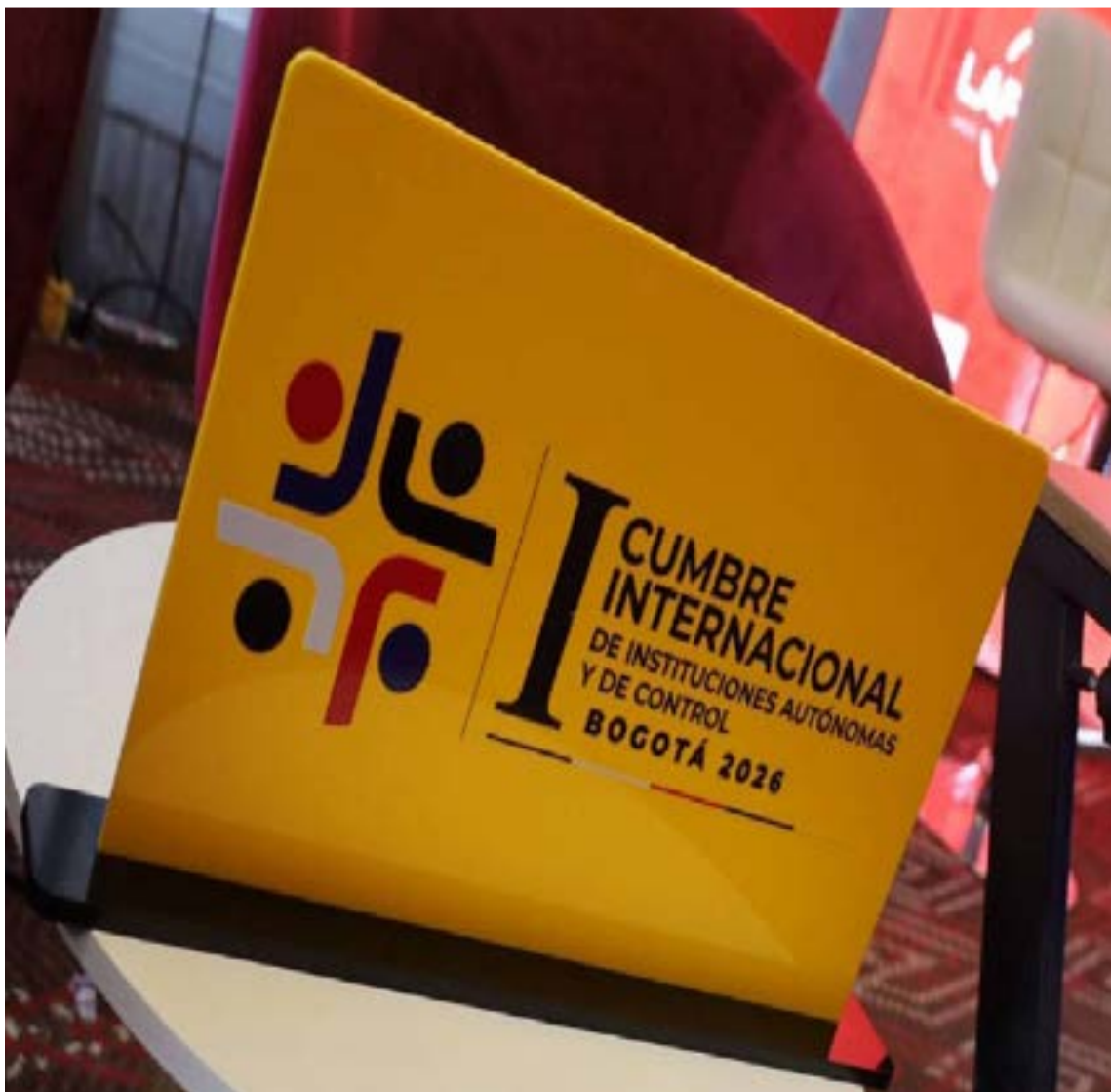
Las tres cabezas del control en Colombia concluyeron que blindar la confianza ciudadana exige la neutralidad de los funcionarios y el respeto irrestricto a las reglas democráticas.

El Registrador Nacional del Estado Civil, Hernán Penagos, respaldó las preocupaciones sobre la desinformación, pero matizó con un balance positivo sobre la cultura electoral de los colombianos. Según Penagos, la ciudadanía comprende cada vez mejor los engranajes del sistema de votación y escrutinio. Los ciudadanos «han aprendido y eso es positivo», celebró. No obstante, el Registrador fue categórico al señalar que cualquier inconformidad o sospecha de irregularidad debe tramitarse exclusivamente a través de los canales jurídicos e institucionales que ofrece la democracia, y no mediante la especulación en el debate público. El Contralor General de la República, Carlos Hernán Rodríguez, enfocó su intervención en la necesidad de desescalar la agresividad en el discurso político, una responsabilidad que, según él, recae principalmente en los hombros de las bitácoras del poder. «Las autoridades debemos dar ejemplo», señaló Rodríguez, haciendo un llamado directo a bajar el tono de la confrontación sin que ello implique renunciar al rigor técnico ni a la independencia fiscalizadora de su entidad. «Se puede disentir de alguna decisión, pero otra cosa es descalificar, eso hace daño», concluyó el Contralor.