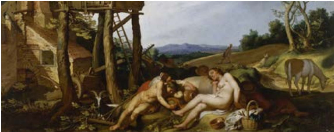
Los campesinos «perezosos» duermen en lugar de trabajar, en representación de la pereza y la indolencia, en la parábola del trigo y la cizaña de 1624, por Abraham Bloemaert.