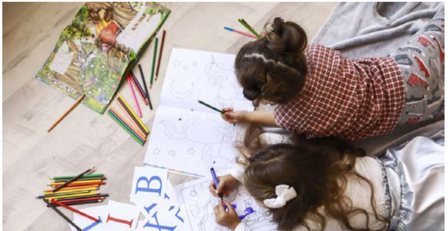
Nuestros menores necesitan respuestas rápidas ante el deterioro de su bienestar emocional.

El contexto del país subraya esta premisa. Para este 2026, el Instituto