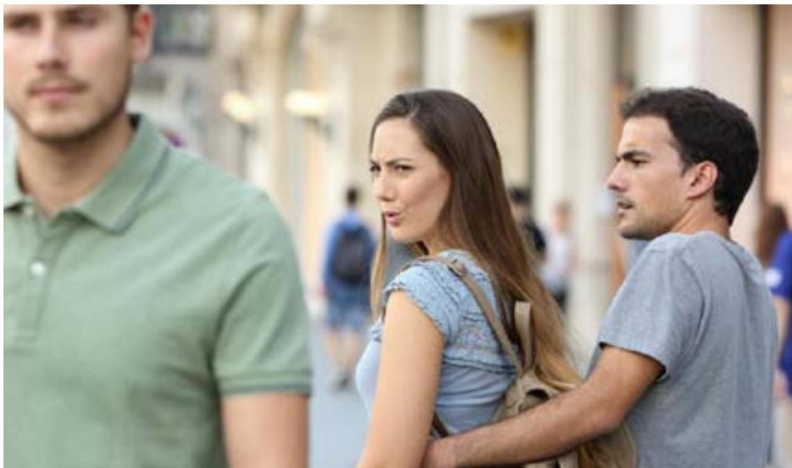
Los celos son un sentimiento de temor a perder a la persona amada.

Inseguridad: el hombre o la mujer celoso (a), sufre una inmensa inseguridad de lo que ella es y de lo que posee. En algunos casos puede deberse a situaciones difíciles del pasado o modelos de educación, que han dejado una marca en su forma de ser. Comúnmente este tipo de personas, no sólo son inseguros