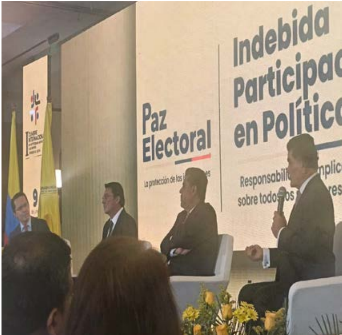
En la Cumbre de Organismos de Control, los jefes de la Procuraduría, Registraduría y Contraloría blindaron la estabilidad democrática del país frente a la polarización. Asimismo, rechazaron los discursos alarmistas y defendieron la transparencia electoral, exigiendo neutralidad a los funcionarios y denunciar irregularidades por vías legales.