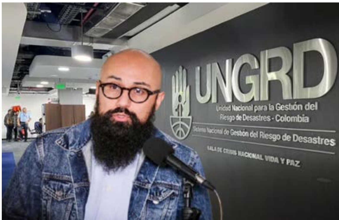
Carlos Carrillo, director de la Unidad Nacional para la Gestión del Riesgo de Desastres, luego de su renuncia al cargo.