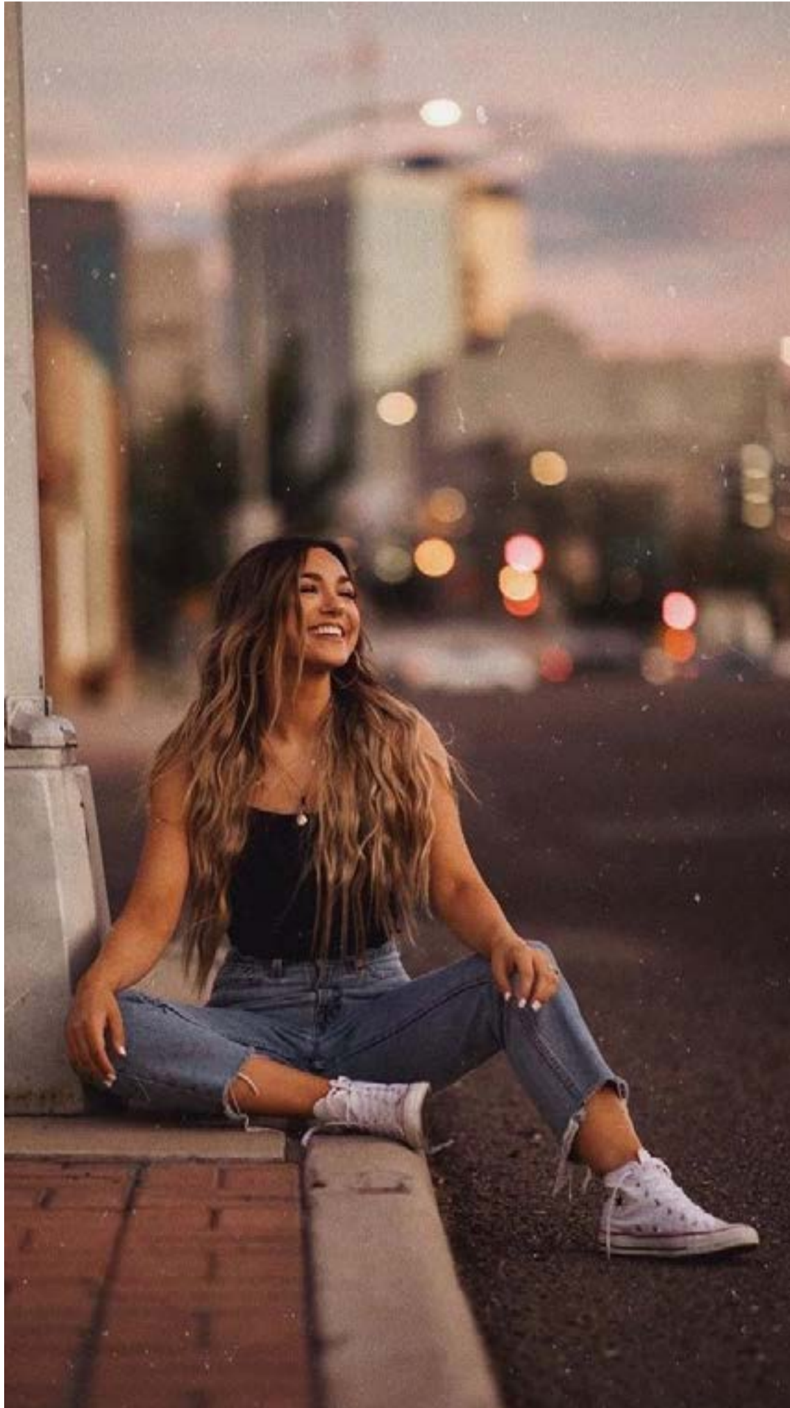
La ciudad es mi escenario

Ricky Martin y Calamaro al Cordillera. El Festival Cordillera 2026 confirmó su cartel oficial liderado por las leyendas internacionales Ricky Martin, Andrés Calamaro