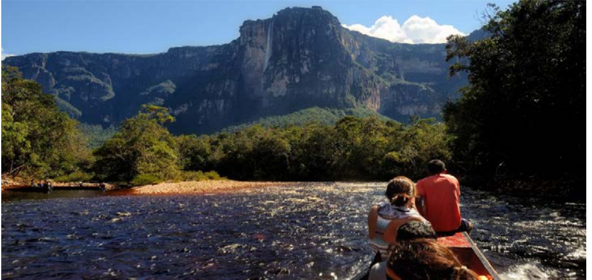
El Kerepakupai Vená o Salto Ángel (Kerepakupai Vená en pemón, que significa «salto del lugar más profundo») es la cascada de agua más alta del mundo, con una altura de 979 m (807 m de caída ininterrumpida). Está ubicado en el Parque Nacional Canaima Bolívar, Venezuela; un espacio natural declarado Patrimonio de la Humanidad. Vista del Kerepakupai desde el río Churún.