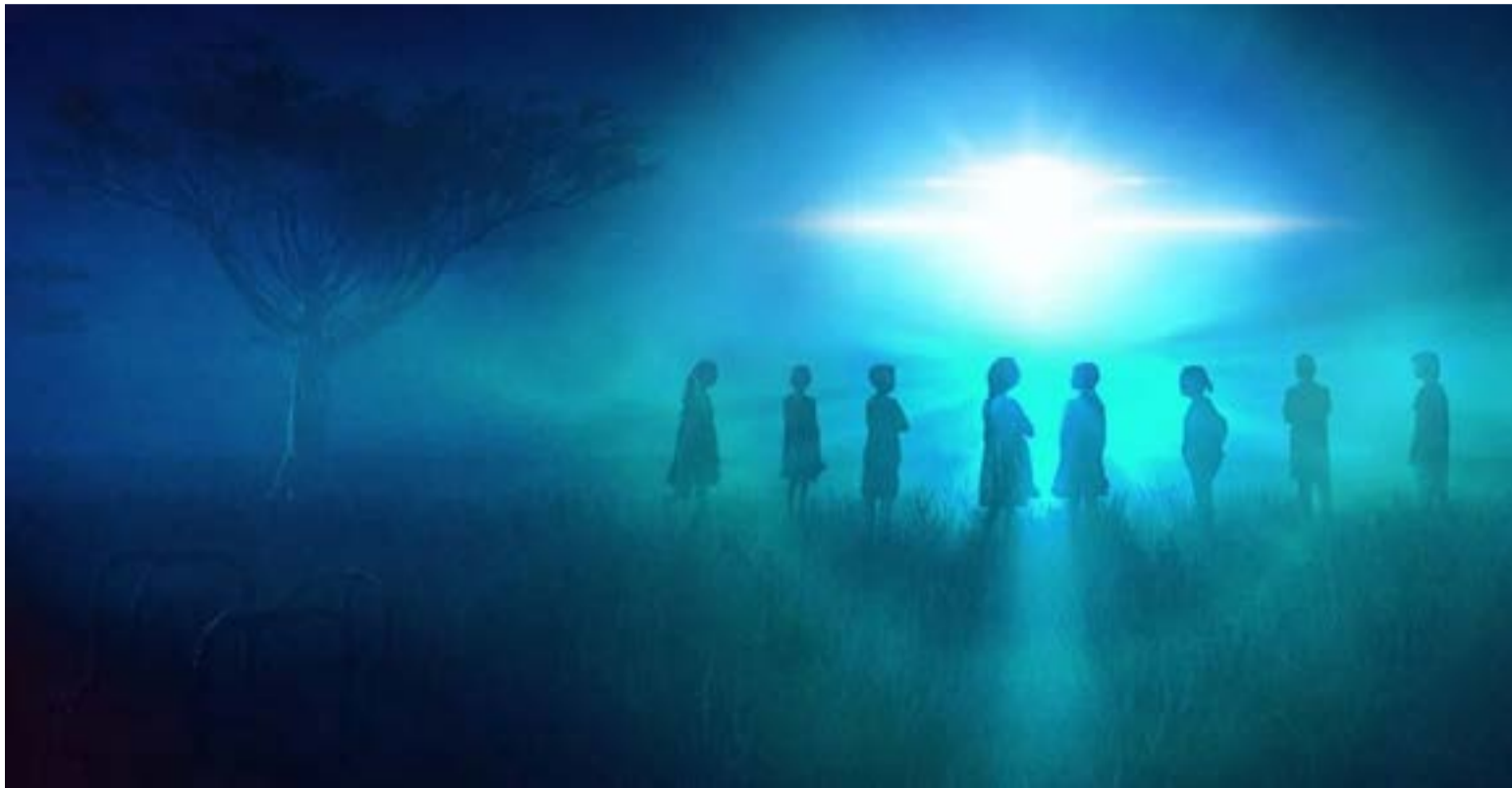
«Hombrecillos de Meoqui»

un dialecto ininteligible. Ante este panorama, ha cobrado fuerza la hipótesis del «mundo intra-terreno», la cual sugiere que estas criaturas no son visitantes estelares, sino antiguos habitantes de las profundidades del desierto chihuahuense, expulsados hacia la superficie por recientes movimientos tectónicos o la agudización de la sequía.